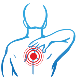
болки в гърба

Бестарен® ти дава бързо и ефективно облекчение при болка в гърба, кръста, ставите, при менструация и зъбобол