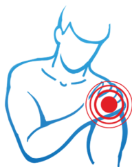
болки в ставите